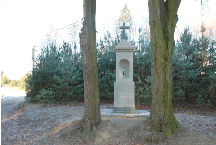
Kapliczka na "Czystym"