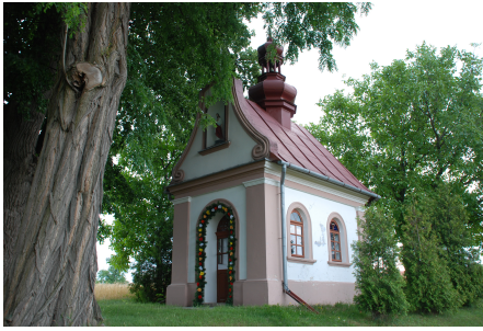
Kapliczka w Wólce Grodziskiej