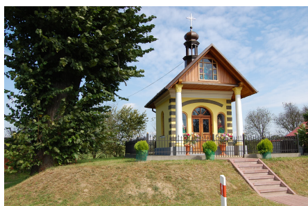
Kapliczka przy drodze Żołyńskiej