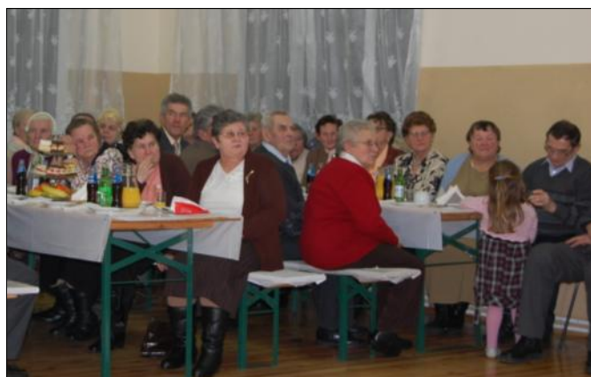
Wspólna biesiada przy stołach

Za okazaną pomoc i wsparcie finansowe organizatorzy składają podziękowania sponsorom, którymi byli: