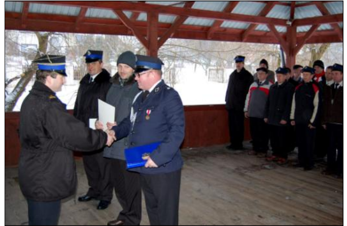
Komendant PSP wręczając klucze podziękował strażakom za dotychczasową współpracę

Gmina Grodzisko Dolne rozumie też potrzeby związane z zakupem samochodu bojowego dla Ko-