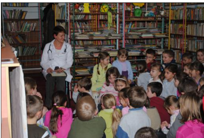
Kolejny wieczór głośnego czytania zgromadził 47 słuchaczy