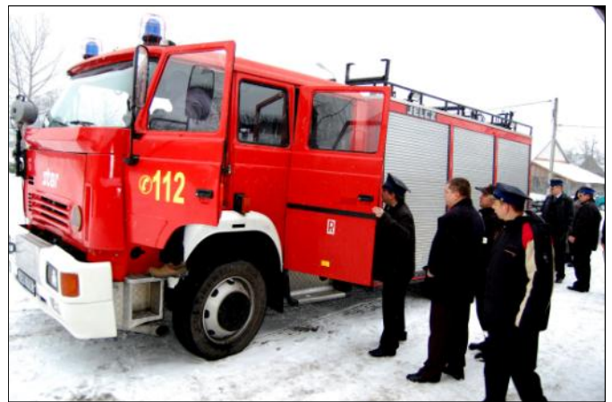
Wóz strażacki ma przejechanych ponad 45 tys. km

mendy Powiatowej w Leżajsku. Na ten cel przeznaczona kwota 42 tys. zł.