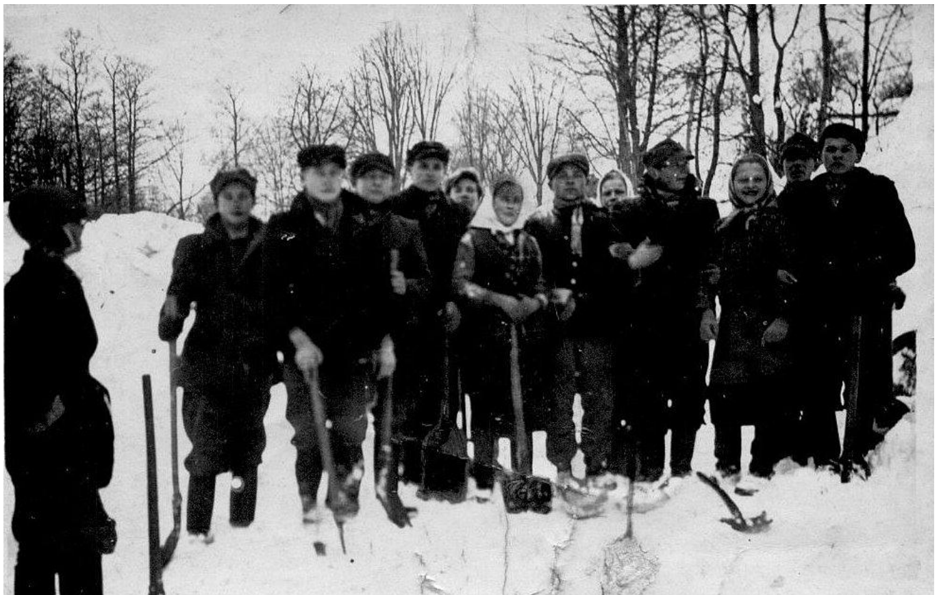
Przymusowe roboty na torach kolejowych w Chalupkach Dębniańskich, lata 1942-1944