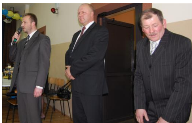
Swoje życzenia Seniorom złożył Wójt i Przewodniczący Rady