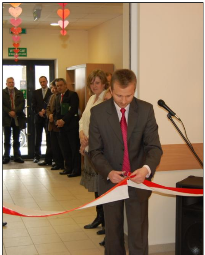
Ceremonia przycięcia wstęgi