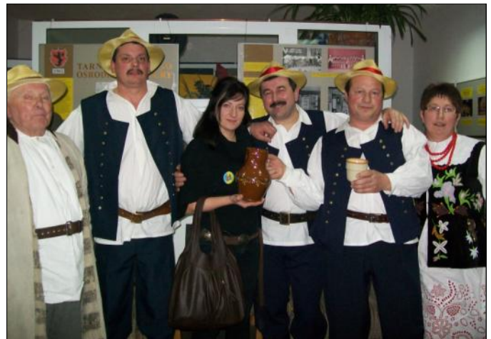
W Sejmiku uczestniczyły zespoły reprezentujące regiony z całej Polski.

Przeгляд widowisk trwał od piątku do niedzieli. Po występach w każdym dniu odbywały się spotkania ze specjalistami z Rady Artystycznej, którzy omawiali programy prezentowane przez zespoły oraz zajęcia warsztatowe.