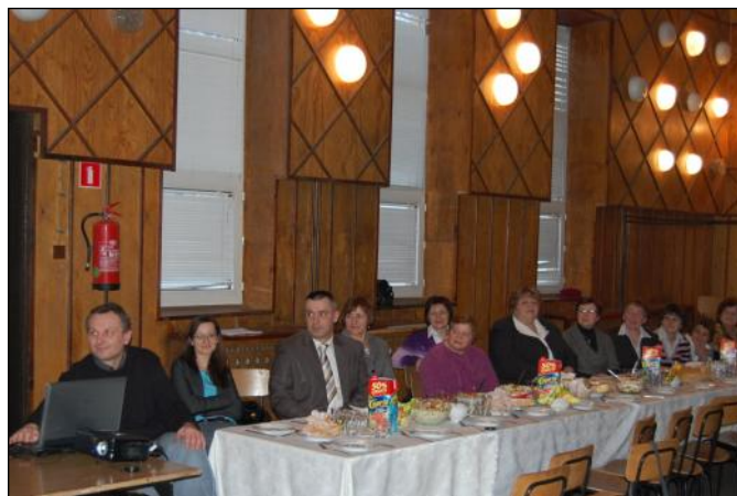
W trakcie prezentacji panie mogły jeszcze raz obejrzeć efekty swojej pracy