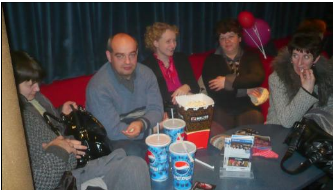
W oczekiwaniu na film