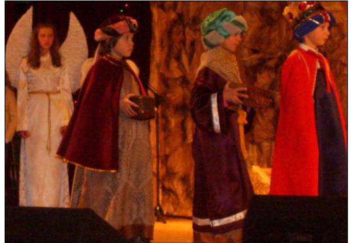
Na scenie w Głogowie Małopolskim nasz teatrzyk wystąpił z przedstawieniem o tematyce bożonarodzeniowej