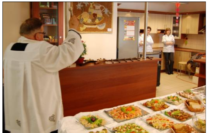
Akt poświęcenia placówki