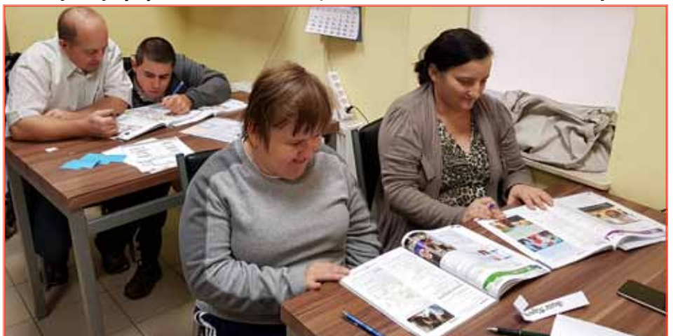
Udział w zajęciach pozwolił przełamać kolejne bariery i ograniczenia