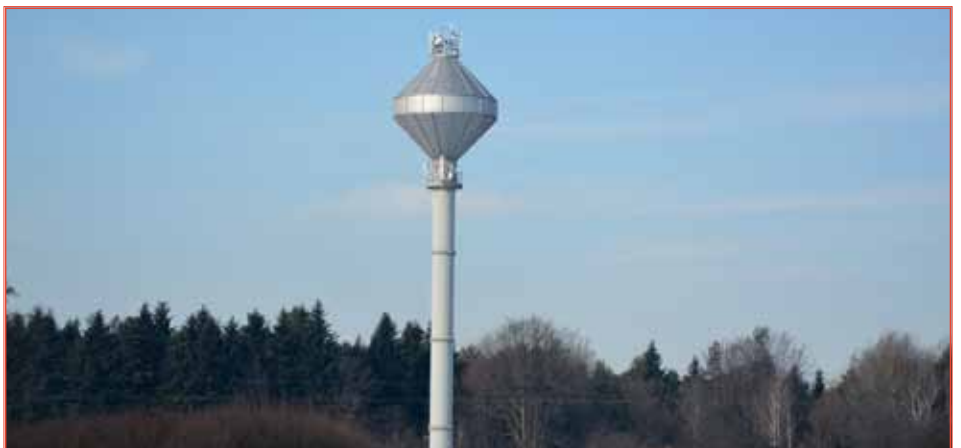
Dzięki masztowni poprawił się zasięg telefonów

sąsiedztwie nadajnika, sprawę udało się doprowadzić do końca. Maszt zamontowano, a mieszkańcy cieszą się, że ich telefony komórkowe nareszcie działają. MH