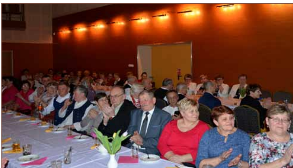
Przy herbatce, szarlotce i specjalnej oprawie artystycznej upłynęło popołudnie w Ośrodku Kultury