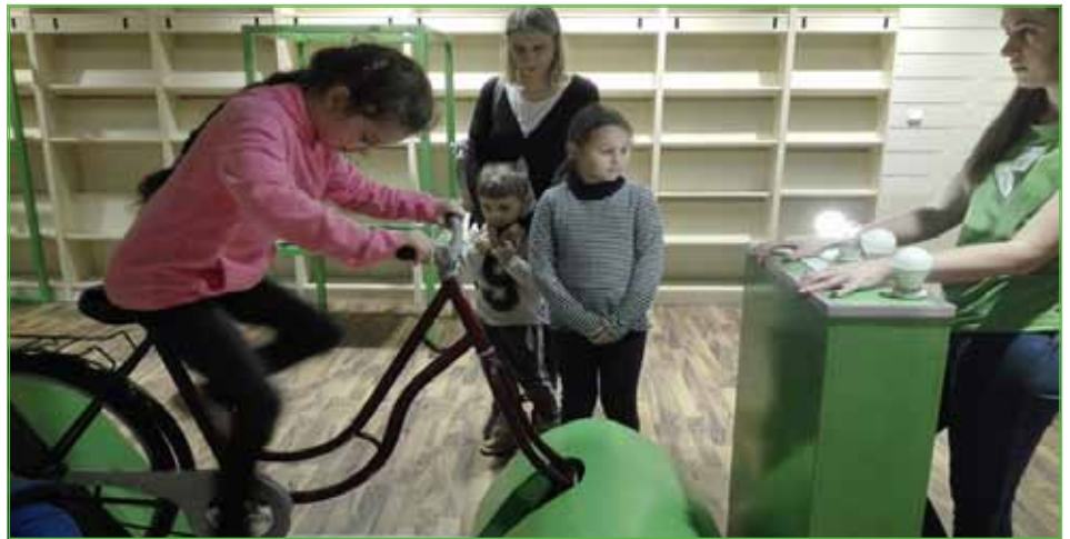
By zasilić żarówki w rowerze prąd wytworzono siłą własnych mięśni