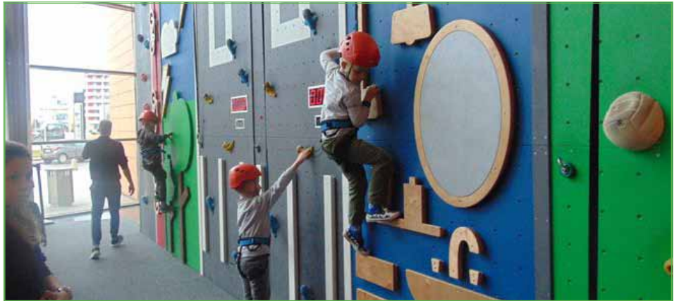
Na ścianie wspinaczkowej