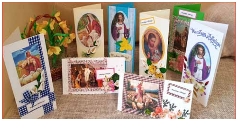
Kartki wykonane przez ŚDS wysyłane są m.in. do instytucji z którymi gmina współpracuje