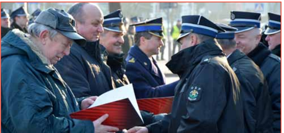
Podziękowania otrzymali długoletni działacze ruchu pożarniczego