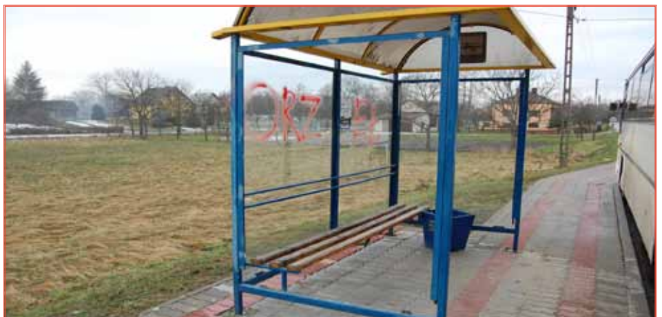
W zeszłym roku chuligani zniszczyli przystanki na kwotę ponad 8 tysięcy złotych