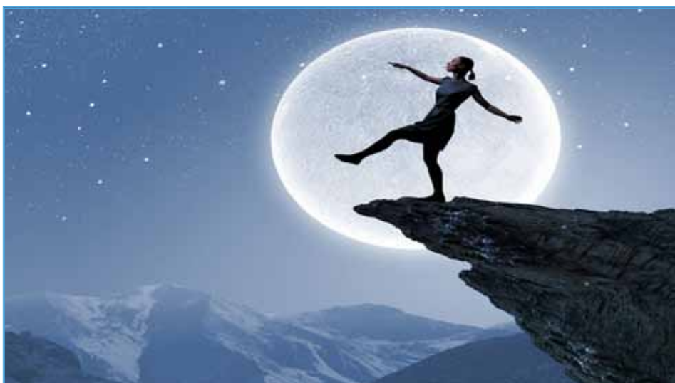
Pełnia ma wpływ na bezsenność i lunatykowanie

Statystycznie przy pełni dochodzi do większej ilości przestępstw, wypadków, samobójstw, rodzi się więcej dzieci, a oddziały psychiatryczne przyjmują więcej pacjentów. Wiele osób skarży się na gorsze samopoczucie psychiczne. Bezdyskusyjny także wydaje się wpływ na bezsenność i lunatykowanie, które występują nawet jeśli śpi się w pomieszczeniu bez okien, co oznacza, że to nie światło jest powodem tych problemów. Zarówno sen, jak i skłon-