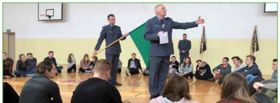
Uczestnictwo w poczcie sztandarowym to zaszczytna i honorowa funkcja