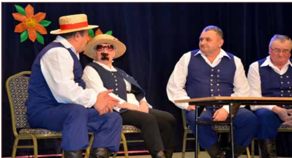
Nad organizacją Dnia Kobiet pochyliła się sama Rada Sołecka