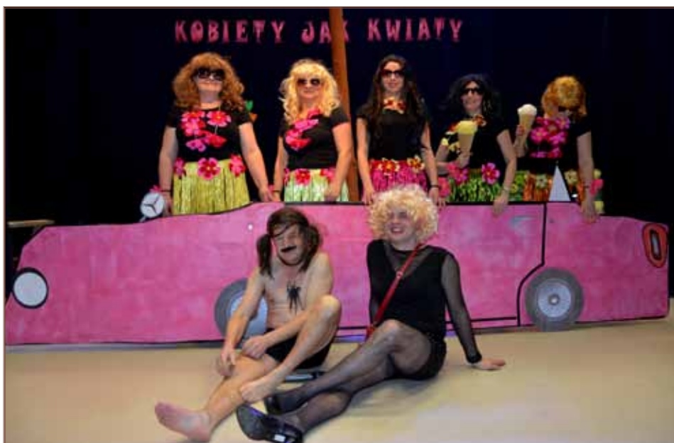
Talentu i pomysłowości grodziskiej kulturze nie brakuje