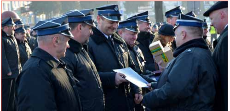
Ziemia grodziska jest kolebką ochotniczego pożarnictwa