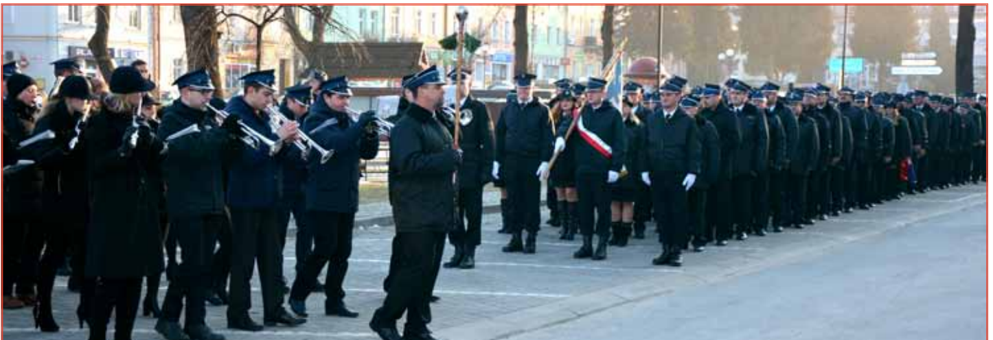
Powiatowe uroczystości uświetniła grodziska Orkiestra Dęta